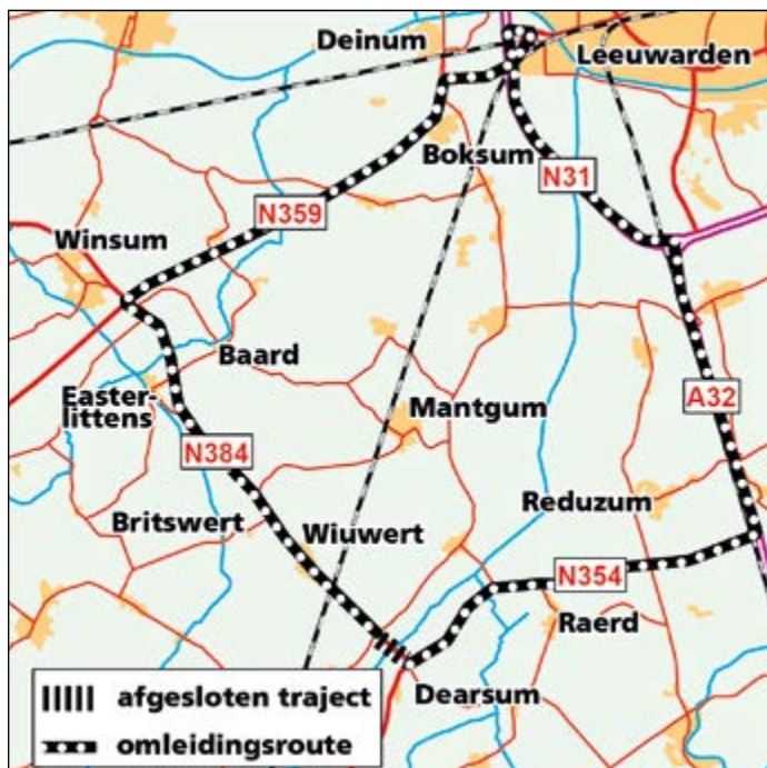
Omleiding voor doorgaand verkeer

Fietsers kunnen tijdens de werkzaamheden gewoon over het fietspad blijven rijden. De buslijnen rijden aangepaste routes. Meer informatie over de routes van de bussen is te vinden op www.arriva.nl/fryslan .