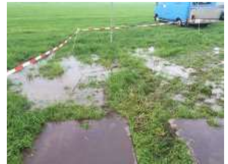
(parkeerterrein vrijdag om 20.00. Dit was de dam waar alle auto's door moesten rijden)

En dan de weilanden, waar de auto's moeten parkeren. Het waren drassige velden geworden en snelle oplossingen voor dit probleem waren vereist.