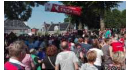
(finish dorpsplein Raerd)

In het dorp heerst een gezellige drukte. Toeschouwers zitten of staan langs de route en bij de finish om de lopers van applaus te voorzien.