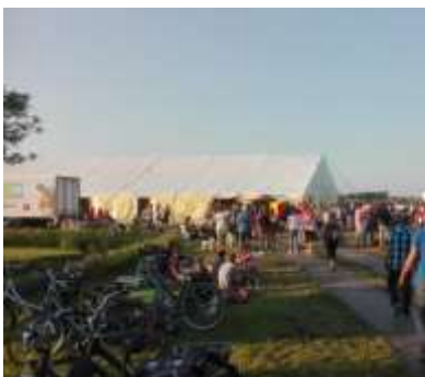
(feesttent op het weiland aan de Hegedyk)

Voor wie nog even gezellig wilde napraten, een drankje nemen of even de voetjes van de vloer speelde er In de feesttent de band "Butterfly". Later op de avond kwam "Lost Shot" in de tent en werd er gedanst en meegezongen uit volle borst. Om 02.00 werd de tent, letterlijk, gesloten en keerde de rust weer terug in het dorp. Naar schatting zijn er 30.000 mensen in ons dorp geweest en ongeveer een 7000 auto's.